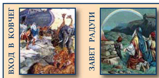
ФОТОДРАМА СОТВОРЕНИЯ или Библейская история в картинках.