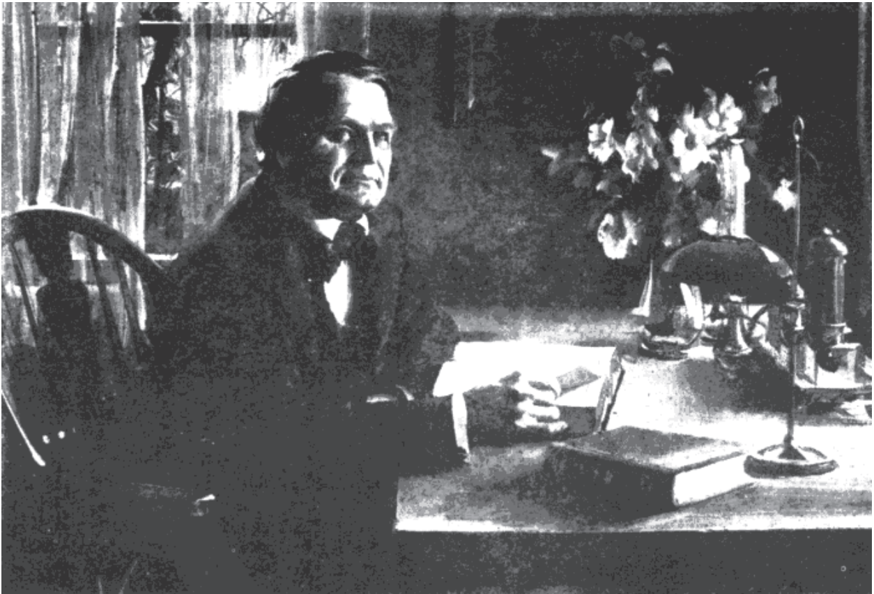
Williamas Milleris savo kabinete, kuriame, prieš pradėdamas viešą tarnybą, 1813–1831 metais tyrinėjo Šventąjį Raštą.

nusprendžiau palikti visus savo išankstinius nusistatymus nuošalyje, kruopščiai lyginti vienas Rašto vietas su kitomis ir toliau studijuoti jį reguliariai ir metodiškai. Aš pradėjau nuo Pradžios knygos ir skaičiau eilutę po eilutės, neidamas tolyn tol, kol ta dalis eilučių netapo man taip aiški, jog neliko jokio misticizmo ar prieštaravimų. Kada surasdavau ką nors neaiškaus – migloto, lygindavau su visomis paralelinėmis eilutėmis. Pasi naudodamas Crudenu (konkordancija, t.y. Biblijos žodžių abėcėline rodykle) ištirdavau visus Šventojo Rašto tekstus, kuriuose aptikdavau kuria nors prasme neaiškius žodžius. Tada, suteikiant kiekvienam žodžiui tam tikrą reikšmę tekste, ir jei mano požiūris derindavosi su kiekviena Biblijos paraleline eilute, abejonės liaudavosi.“