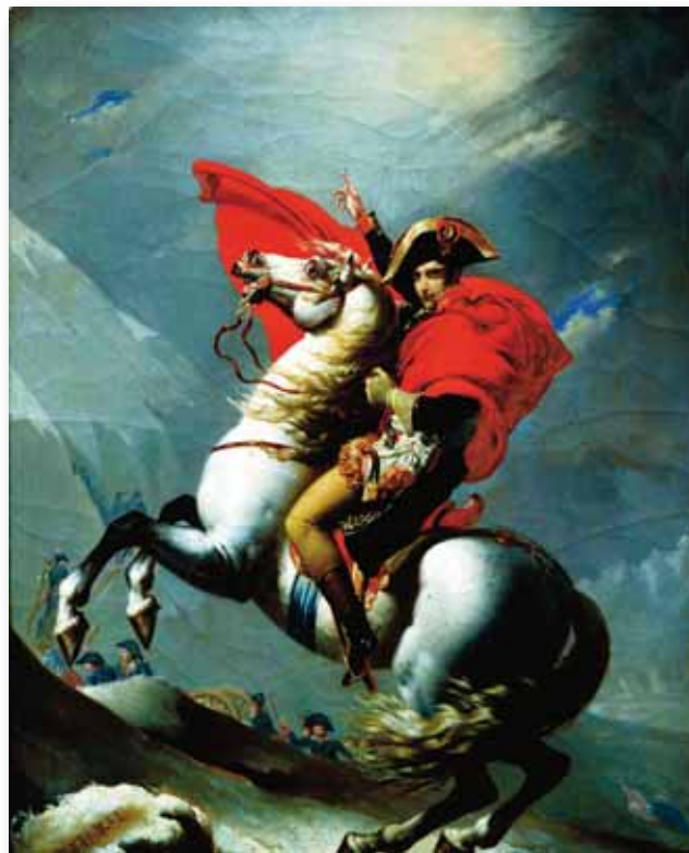
Наполеон во время перехода через Альпы

Смотрите Исследования Писаний Пастора Рассела, Том 3, Да Придет Царствие Твое , стр. 40-47.