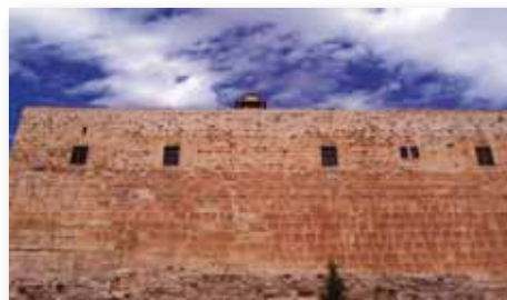
Храмовая Гора, вид снизу

Да, без сомнения, это именно то, что саддукеи и фарисеи имели в виду, рассчитывая на то, что Иисус не сможет этого сделать. Мы знаем, что Господь понимал, что еще не было время для такого рода откровений, исходящих от Бога. Так было потому, что у них тогда было Священное Писание Ветхого Завета, которого не было у Илии. Им не нужно было никакое чудо с неба. Все, что они должны были делать, это читать Писание, которое указывало на знамения времен и на то, что Иисус, их Мессия, был уже среди них. Подобно и мы могли так сделать и проанали-