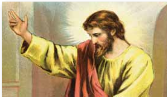
Иисус – Глава Церкви

Когда мы приняли Божественное приглашение (Рим. 12:1) и отдали Ему наше сердце, все, что у нас есть, как посвященные