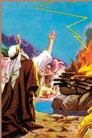
ЗНАМЕНИЕ ВРЕМЕН ВЕТХОГО ЗАВЕТА