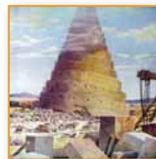
Вавилонская Башня – Быт. 11:1-9