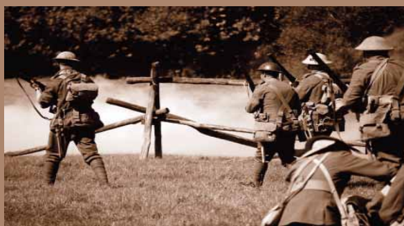
ЗНАМЕНА НАСТОЯЩЕГО ВРЕМЕНИ 1914 – I Мировая война, начало времени скорби

уже идет, то он фактически пришел бы к убеждению, что они ошибались относительно ее начала. Они не собираются идти на небеса перед скорбью, – когда разразится Армагеддон, – как многие раньше думали, поскольку они и дальше остаются на земле.