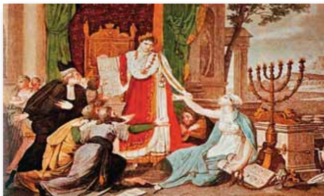
Наполеон дарует свободу евреям

Легко поддаваться искушению цитировать признанные источники и получать информацию из второстепенных источников, вместо того, чтобы заняться начальным исследованием. Цитирование документа, написанного одним историком, и некритичное повторение другим быстро завоевывает авторитет «всеобщего знания». Эта статья не основывается на общепринятом мнении историков, но на основательном исследовании. После многих лет сбора информации, главным образом из первоисточников, а также после получения доступа к архивам в Каире, Александрии, Тель-Авиве и Иерусалиме и после исследования еврейской литературы, говорящей о Наполеоне, эта часть наполеоновской истории может теперь стать понятна еще лучше.