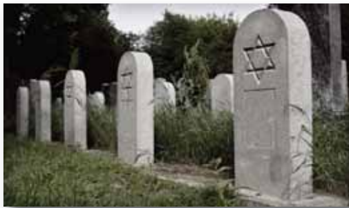
Анонимные еврейские могилы

их и эмигрировала в Святую Землю. Они бы обиделись, если бы мы так сказали, что их Бог позволил, чтобы на них пришло такое наказание за их грехи и плохое поведение. Однако рано или поздно Господь устранил их ослепление, и они узрят своего Мессию (Рим. 11:25,26). Мы наблюдаем за всей той скорбью, которая приходит на Израиль, но в надлежащее время больше не будет никаких преследований евреев – никакой скорби для евреев. Однако после всего этого, согласно Священному Писанию, еще одна большая катастрофа произойдет на их горизонте. Еще придет, как вторая часть скорби Иакова, могущественная армия, собранная из разных народов, которая захочет их уничтожить. Ради этого она войдет в Иерусалим. В Священном Писании, между прочим, они описаны как