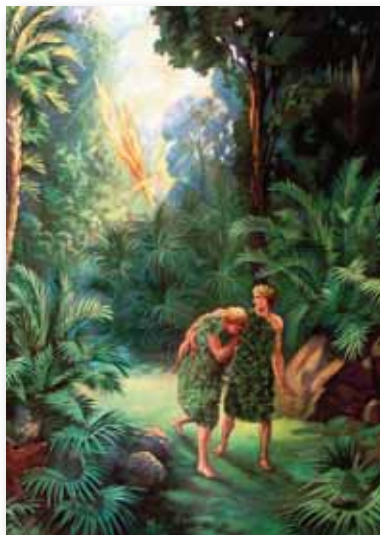
Изгнание из Сада

и склонности. Все ищущие Божьего Царства склоняются посредством Божьего слова к большой бдительности относительно всех обманов противника, а особенно его желания увести нас с узкого пути. Будет хорошо, если мы будем бдительными, обращая внимание на дух всех тех, с кем мы имеем