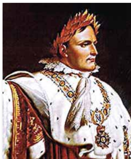
Император Наполеон, во время своей коронации, с орденом Почетного Легиона, который был утвержден в 1802 году.

Кодекс Наполеона установил равенство перед законом, подчеркнул нерушимость семьи и гарантировал правовые завоевания Революции. Гражданский Процессуальный Кодекс гарантировал широкое применение посредничества в судах и в правах, а суды были сделаны светскими. Наполеон создал Императорский Университет, чтобы руководить французским образованием. Для