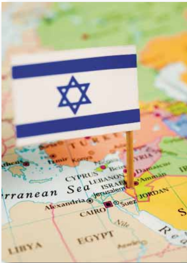
Израиль обрел государственность, 1948 г.

Наполеон немедленно дал евреям позволение на постройку синагоги. А теперь поразительный инцидент, который не был широко известен. Когда французские подразделения находились в Палестине и осаждали город Акр, Наполеон уже приготовил декларацию, которая признавала Палестину независимым еврейским государством. Он был убежден, что сможет захватить Акр, и в ближайшие дни войдет в Иерусалим, где провозгласит декларацию. Однако он не смог реализовать своего проекта по причине британской интервенции. Декларация была датирована 20 апреля 1799 года, но его неудачная попытка захватить город Акр помешала провозгласить декларацию. Евреи должны были примерно 150 лет ждать провозглашения декларации независимости своего государства. Эта декларация все же принесла свои плоды. Она была предвестником сионизма, поднимающая вопрос еврейской государственности. Выраженные идеи Наполеона нашли признание в глазах многих, кто видел в шагах Наполеона исполнение библейского пророчества, предсказывающего возвращение евреев на их родину. Эта идея обрела много сторонников, особенно в Англии.