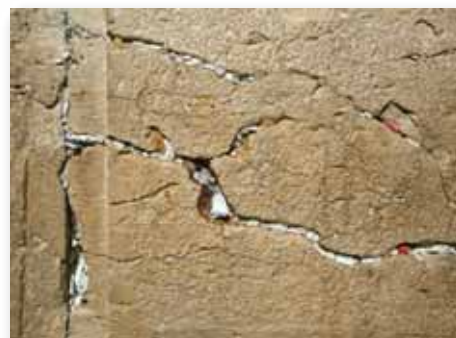
Знаки в трещинах храмовой стены

Чтобы ознакомиться с образным значением других аспектов Скинии и Храма, смотрите книгу Тени Скинии.